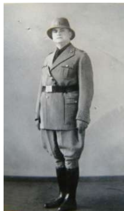
Divisa estiva Anno 1927