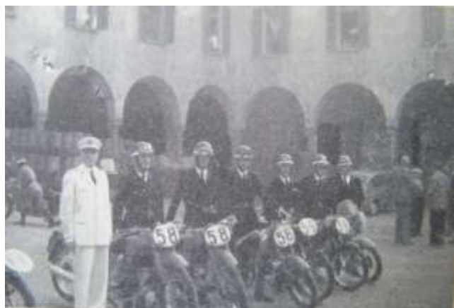
Squadra motociclistica partecipante alla corsa internazionale di Pavia (s.d.)