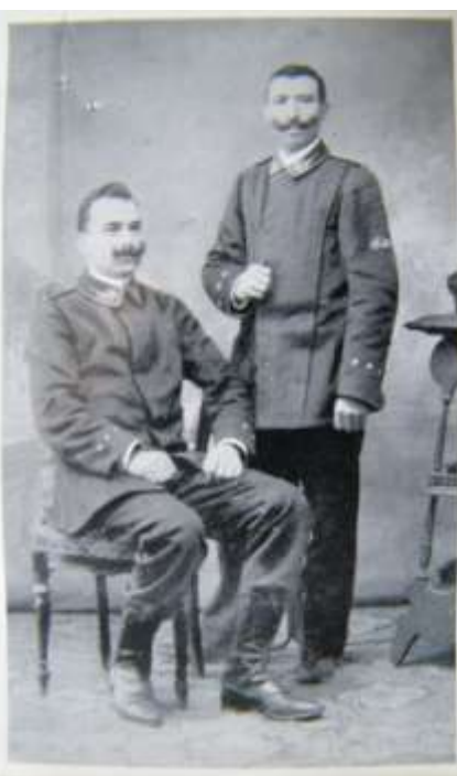
Divise Graduati Anno 1910