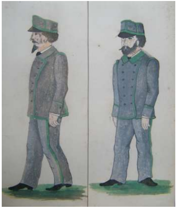
Comune di Monte Olimpino - Regolamento delle Guardie rurali e bozzetti delle divise (1881)