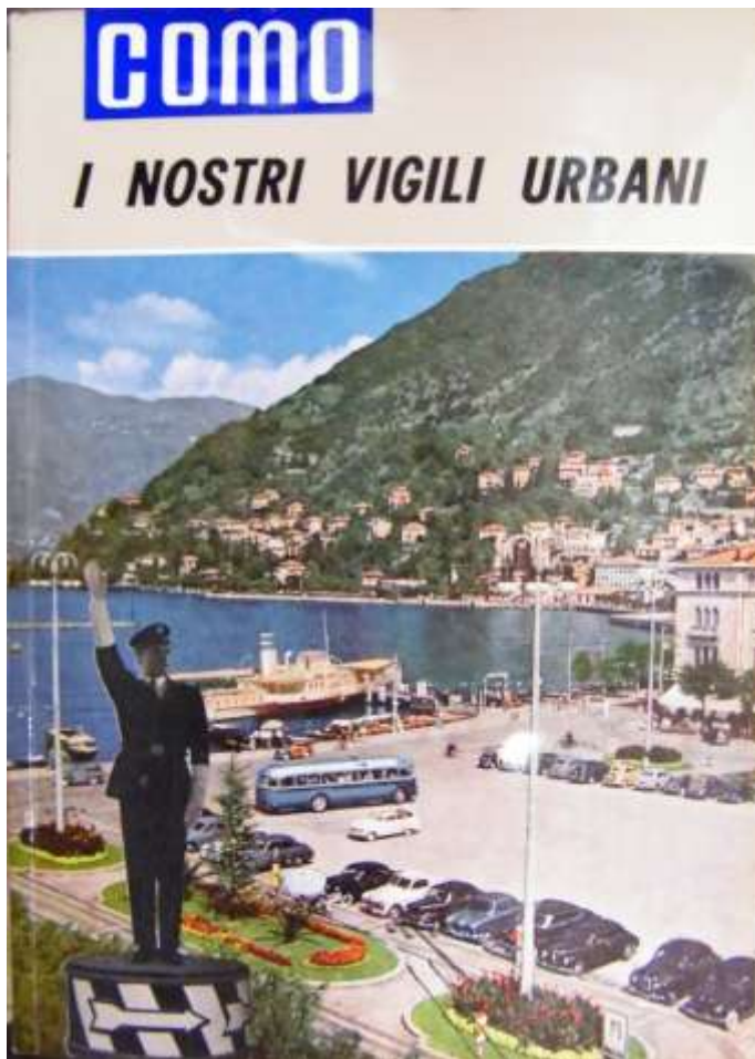
Numero unico della rivista "Como", 1962, "I nostri Vigili urbani", in occasione del 93° anniversario di fondazione (con le foto che seguono)