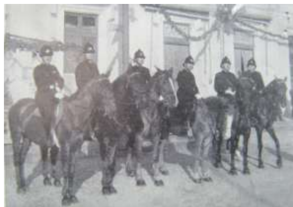
Gruppo di Vigili a cavallo (dal 1927 al 1939)