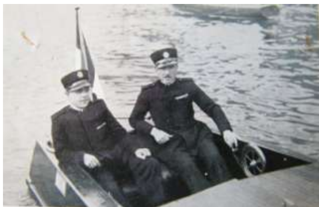
Vigili urbani in servizio di pattuglia sul lago con motoscafo (post 1927)