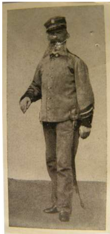
Una delle prime divise adottate dal Corpo