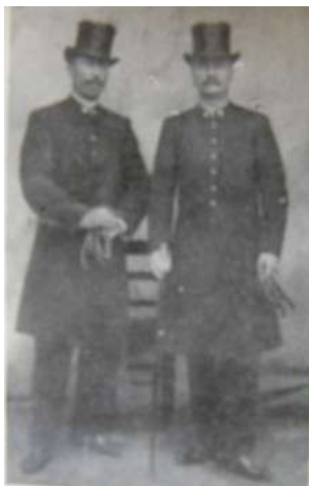
Divisa col cilindro Anno 1890