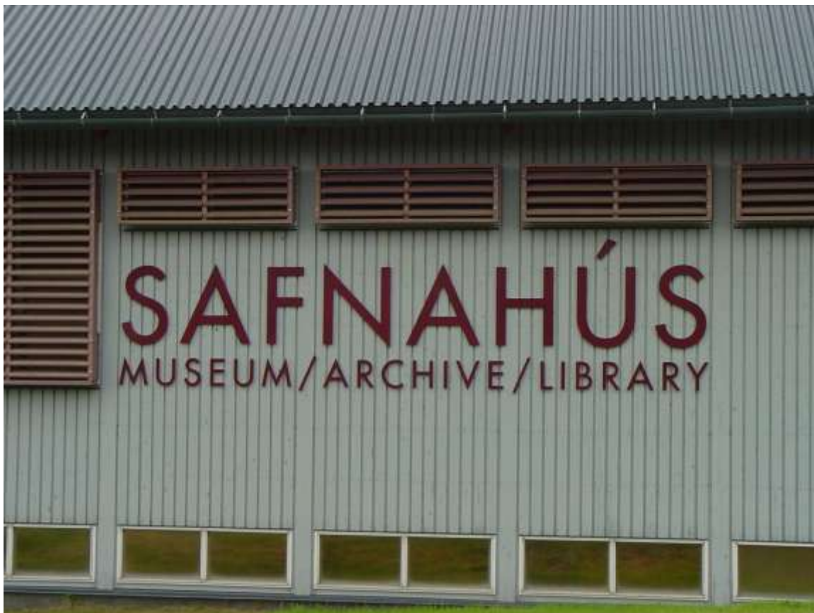
Egilsstaðir, piccolo centro nel nord - est dell'Islanda Museo, archivio e biblioteca