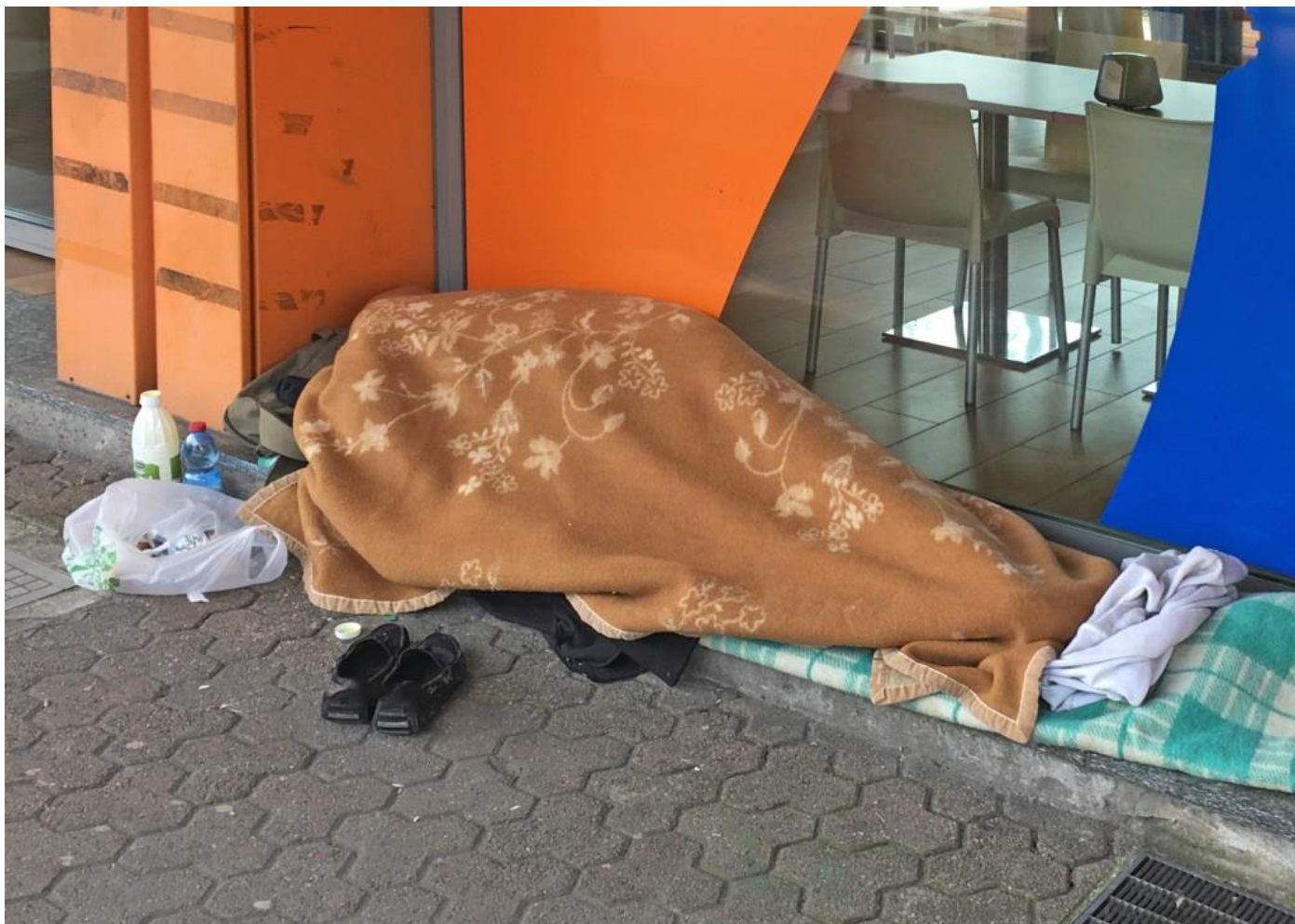
Per un dormitorio pubblico aperto tutto l'anno